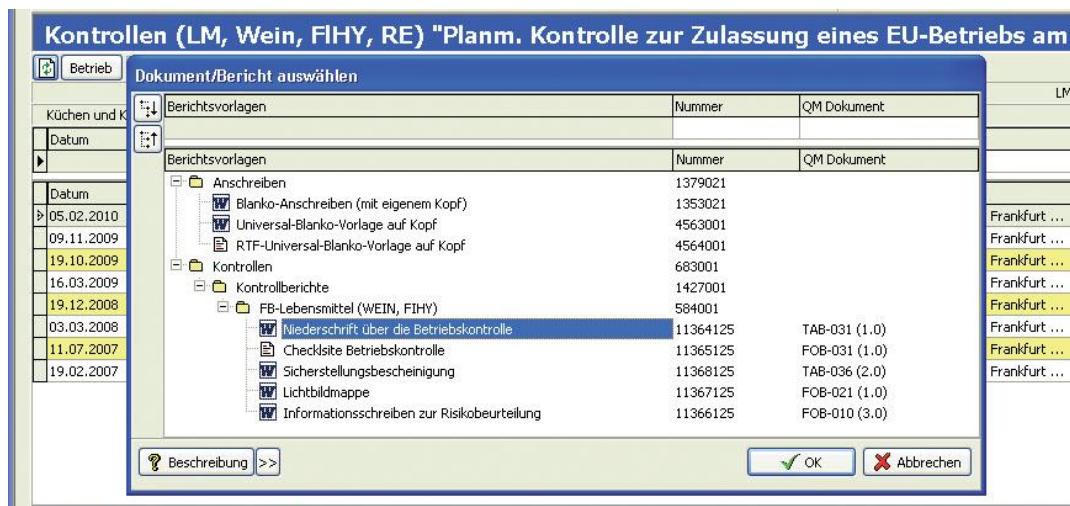
Abb. 2: Beispiel für die Verknüpfung mit Berichtsvorlagen

Es besteht die Möglichkeit, freigegebene QM-Dokumente mit Berichtsvorlagen zu verknüpfen. Dem Anwender von BALVI iP wird damit deutlich gemacht, auf welcher Grundlage des QM-Systems die von ihm auswählbaren Anschreiben und Dokumente erstellt wurden. Außerdem wird der Freigabestatus bei der Auswahl der Vorlagen angezeigt und damit automatisch auf veraltete Dokumente hingewiesen.